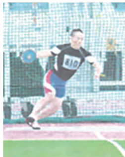
東日本マスターズ2013年国立競技場

現在、陸上教室で小中高生に投てきを教えているが、小中高生は、教えたことに対し吸収が早く記録向上が著しい。でも同じよう練習がこなせるよう一緒に運動している。おじさんだけで簡単には負けないよという気概だけは持って。陸上を通して人生を豊かにする喜びを次の世代に繋げていきたい。体が痛く思った通りの動きができていないが、もう少し体が動けばまた長野マスターズだけでなく、全国のマスターズ大会や全日本マスターズに参加したい。