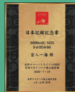
2020年度日本記録記念章楯